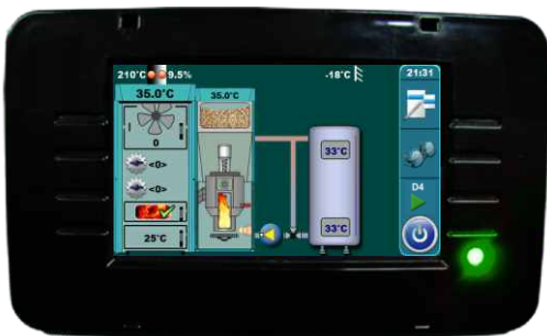
Panou de comandă multifuncțional cu touch screen.